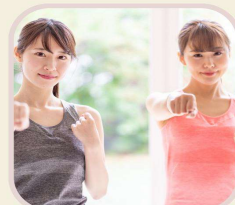
ボクサエクササイズ